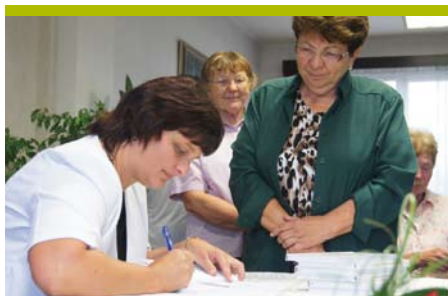
Křest knihy o Hradištku