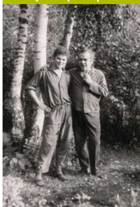
Tatínek se synem v Kersku

• Premiéra byla v Semicích v kině, otec tam samozřejmě byl. Asi osm let předtím vyšly povídky knižně. Když si tu svoji, která byla jen o něm, přečetl, tak řekl, že to ten Bogan přehnal. Levé boty... Říkal jsem mu, že je to umělecká nadsázka, to se nedá nic dělat. Do filmu se všechno nevešlo, tak se dvě postavy musely spojit do jedné.