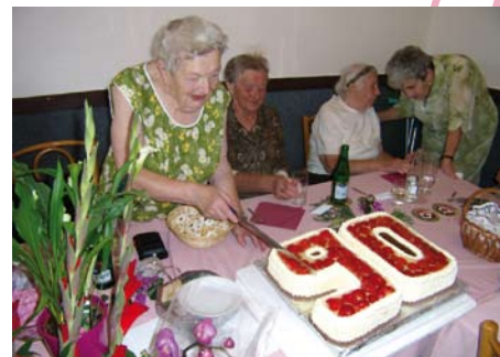
1 x foto: J. Šestáková

přišli zástupci obce i klubu mladších důchodců. Oslavy probíhaly několikrát také s přáteli a rodinou. Však si to paní Zavadilová pro svůj elán, moudrost a dobrou duši zaslouží. Ze srdce blahopřejeme!