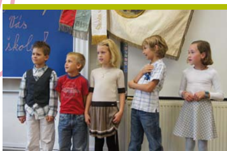
Hradištkým dětem začala škola

Podzim – číslo 11, ročník III., září 2013