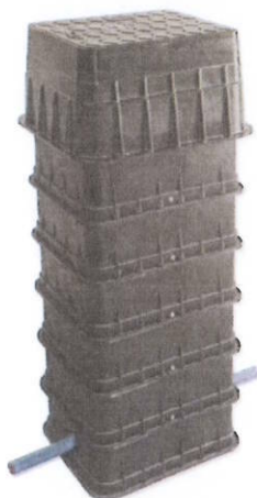
Šachta MODULO 1 Výškově stavitelný rám Výška 115 až 130 cm, poklop do 12,5 t