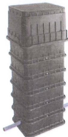
Šachta MODULO 1 S Výškově stavitelný rám Výška 115 až 130 cm, poklop do 0,5 t