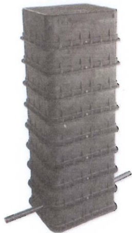
Šachta MODULO 1 N Bez stavitelného rámu Fixní výška 135 cm, poklop do 0,5 t