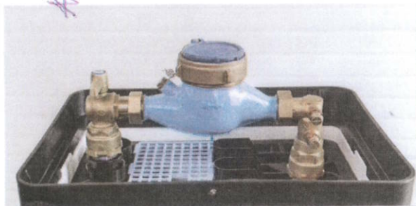
MODULO 1 N, 1 S a 1: Kulový kohout před vodoměrem a zpětná klapka s odvzdušněním, pro vodoměr DN20 (závit 1")